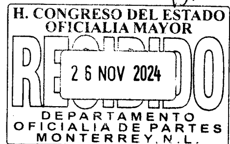
DIP. ITZEL SOLEDAD CASTILLO ALMANZA

GRUPO LEGISLATIVO DEL PARTIDO ACCIÓN NACIONAL