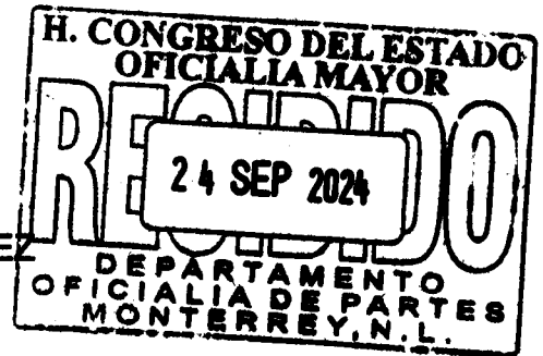
CECILIA SOFÍA ROBLEDO SUÁREZ DIPUTADA LOCAL